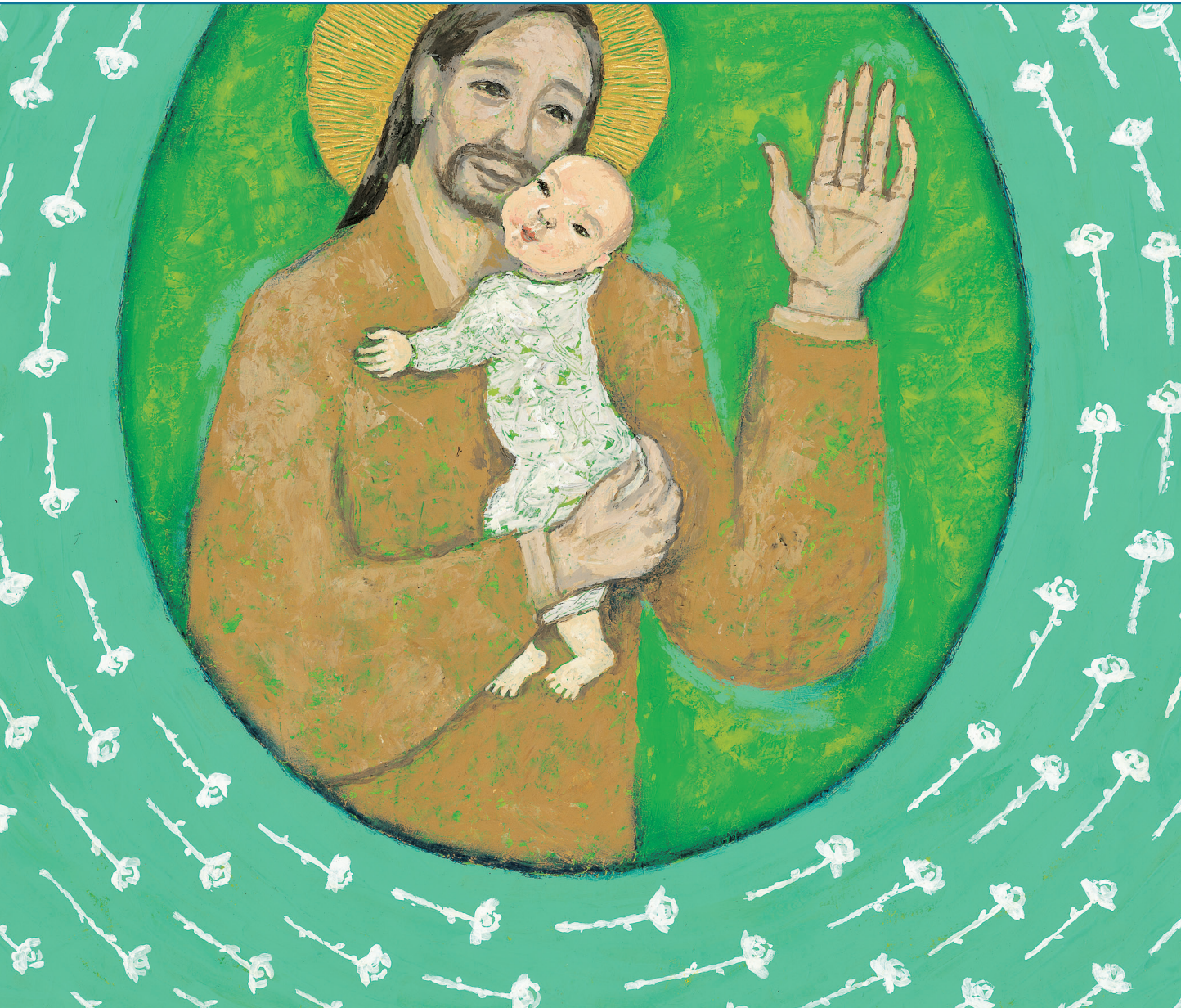
그림 : 정미연 소화데레사

2018년 교구장 사목교서 - “여러분 자신이 변화되게 하십시오.”(로마2,2)