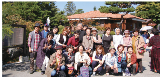
전주교구 가톨릭문우회 정지용문학관 문학기행 9월 30일(주일)